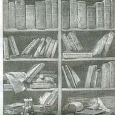
Promozione della lettura Alcuni momenti della presentazione di "Ottobre Piovono Libri" che si svolgerà dal 1° al 31 ottobre